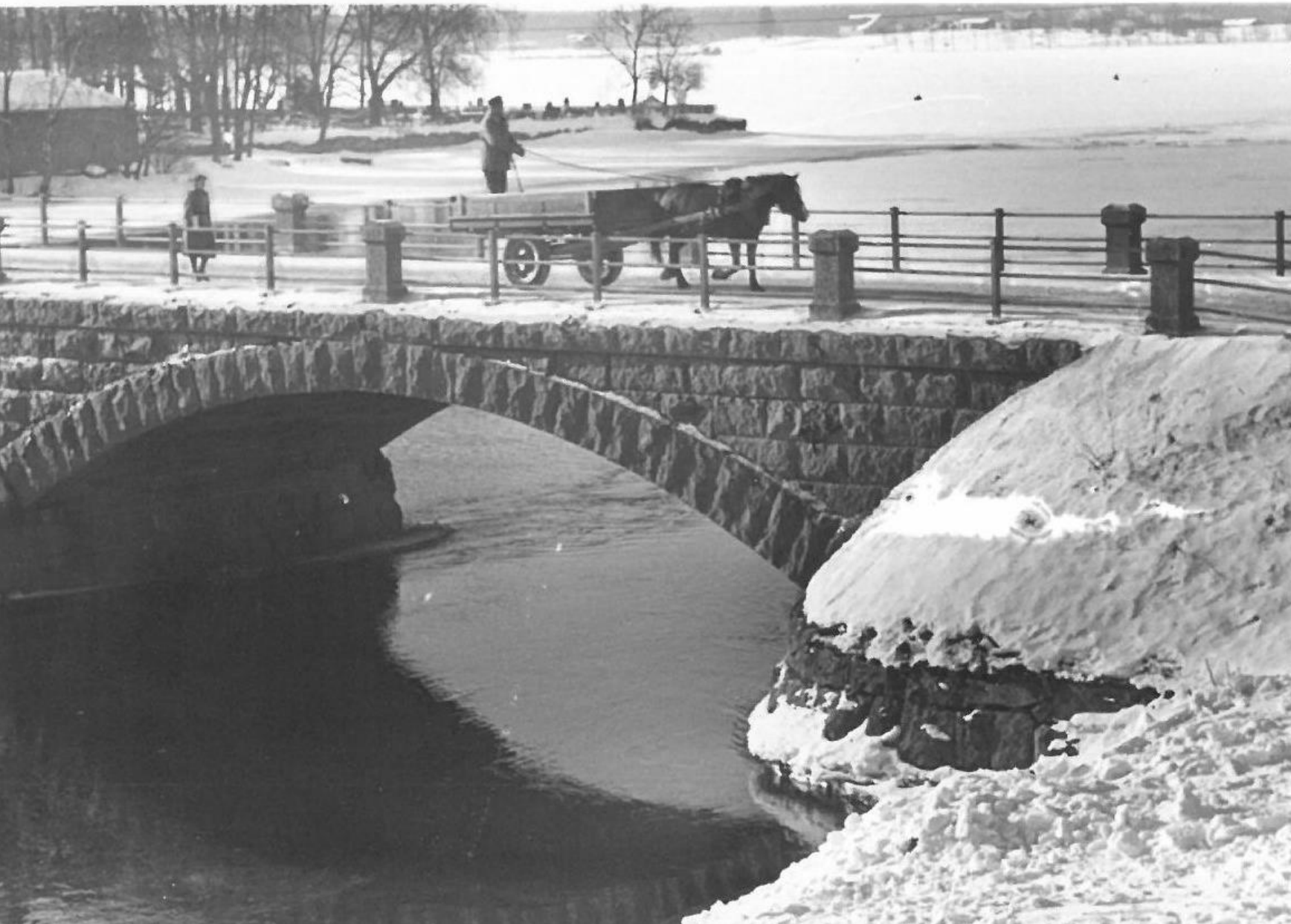
Mies matkalla Tyrvään rautatieasemalle.