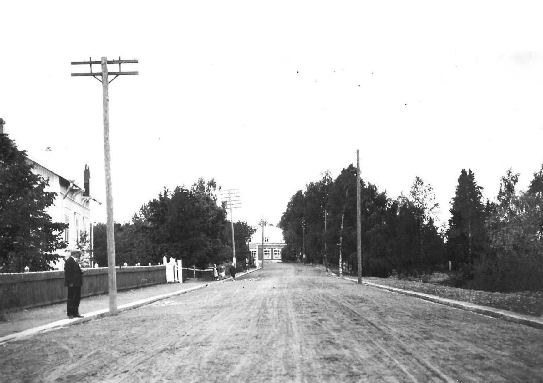
Marttilankatua Yhteiskoulun kohdalla.