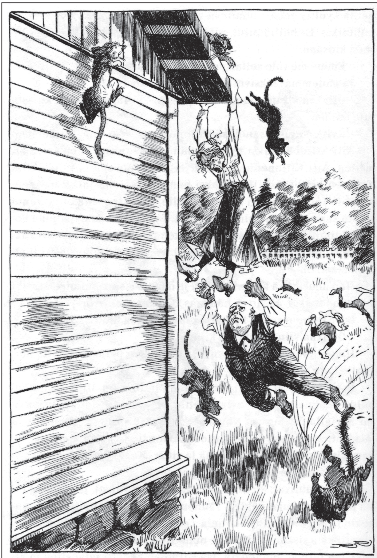
Tällainen sekamelska vallitsi filmin kuvauksissa