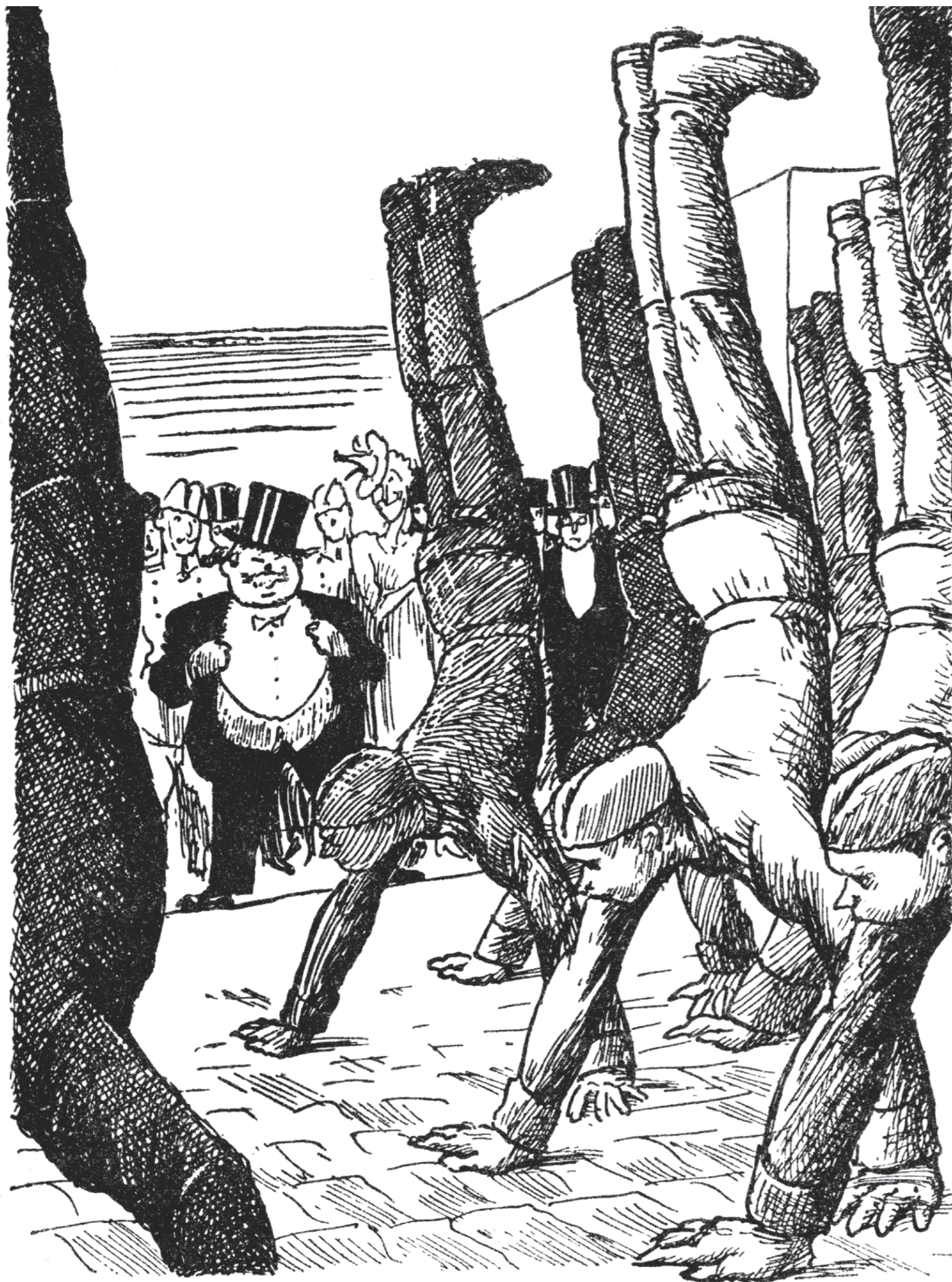
Marssijat kunnioittavat presidentti Kiljusta.

Kertaamme Kiljusten edesottamuksia lehtemme lukijoille, sillä kaikki eivät välttämättä tunne tätä merkittävää perhettä. Jalmari Finne on kynäillyt heistä useita kirjoja, sillä niin kuuluisia he ovat. Perheen vaiheista kertoo esimerkiksi vuonna 1914 ilmestynyt Kiljusten herrasväki.